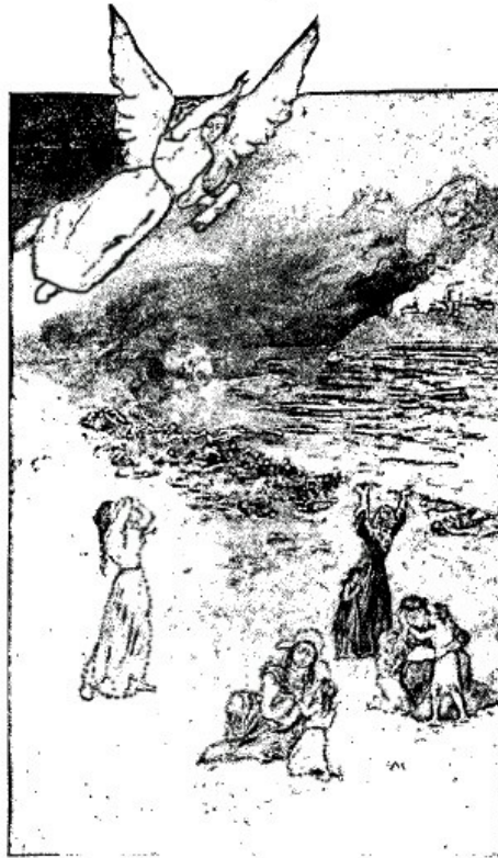
El ángel de las aguas: El mar se vuelve como la sangre de un hombre muerto.

“Estas plagas no son universales, de otra manera los habitantes de la la tierra serían completamente cortados. Sin embargo, serán los más terribles flagelos que jamás hayan sido conocidos por los mortales. Todos los juicios sobre los hombres, antes del cierre de la gracia, han sido mezclados con misericordia. La sangre suplicante de Cristo ha protegido al pecador de recibir la medida completa de su culpa; pero en el juicio final, la ira se derrama sin mezcla de misericordia”.—“The Great Controversy”, páginas 628, 629.