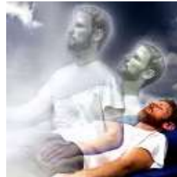
7-LA NO INMORTALIDAD DEL ALMA