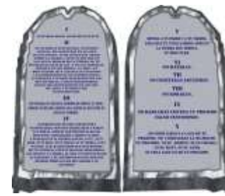
5-LA LEY DE DIOS