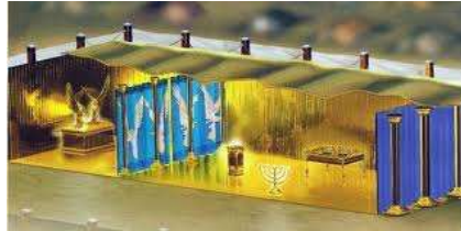
4-EL TEMPLO DE DIOS

16:21 Y del cielo cayó sobre los hombres una enorme granizada, con piedras de casi un talento de peso (unos 34 klg). Y los hombres blasfemaron a Dios por la plaga del granizo, porque la plaga fue muy grande.