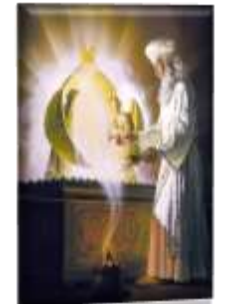
1-PURIFICACION DEL SANTUARIO