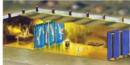
4-EL TEMPLO DE DIOS

16:21 Y del cielo cayó sobre los hombres una enorme granizada, con piedras de casi un talento de peso (unos 34 klg). Y los hombres blasfemaron a Dios por la plaga del granizo, porque la plaga fue muy grande.