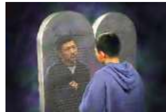
3-LOS MANDAMIENTOS DE DIOS Y LA FE DE JESUS