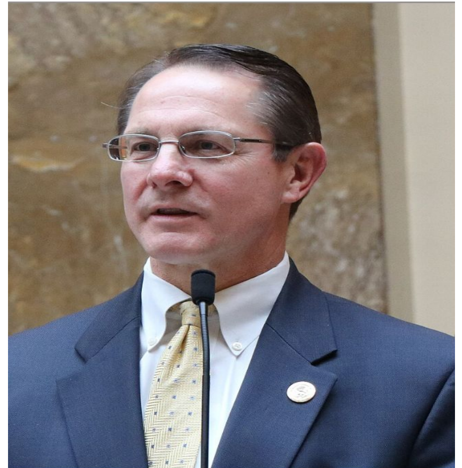
Representatives from the 47th district (2011-2019).