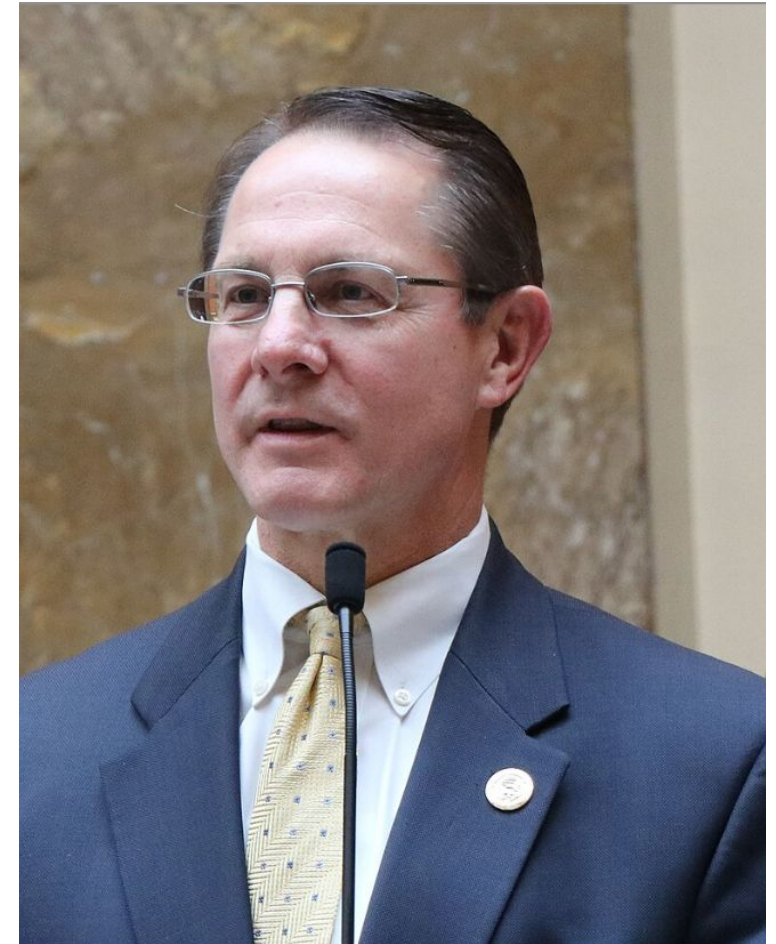
Representatives from the 47th district (2011-2019).

“Las iglesias protestantes se unirán al poder papal para perseguir a los observadores de los mandamientos. Esta unión será cimentada por el gran apóstata. Mientras busca unir a sus adeptos en una gran unidad, instará a sus seguidores a suprimir la disidencia e imponer la observancia del domingo” (Last Day Events, p. 144).