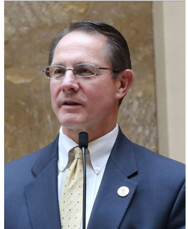
Representatives from the 47th district (2011-2019).

[1] https://www.sltrib.com/religion/2025/01/09/lds-lawmaker-proposes-bill/