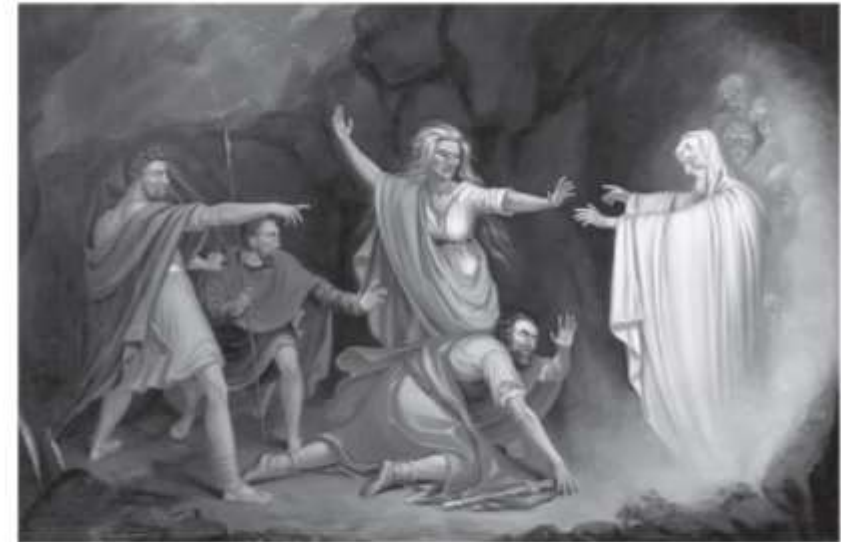
La costumbre de tratar con espíritus o adivinos fue declarada abominación para el Señor y era solemnemente prohibida so pena de muerte. (Levítico 19:31; 20:27.) Saúl consultando a la pitonisa de Endor (1 Samuel 28:7).