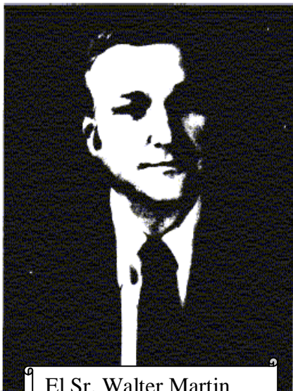
El Sr. Walter Martin

Él había sido comisionado a investigar el adventismo más plenamente en favor de la revista Eternity . Se sobreentendía que su investigación llevaría a una conclusión desfavorable; no obstante, él expresó su deseo de conducir una evaluación completa y razonable. Para lograr esto, se requeriría acceso tanto a las fuentes históricas como humanas de la iglesia Adventista del Séptimo Día. Su requerimiento era simple: "Por favor, cooperen".